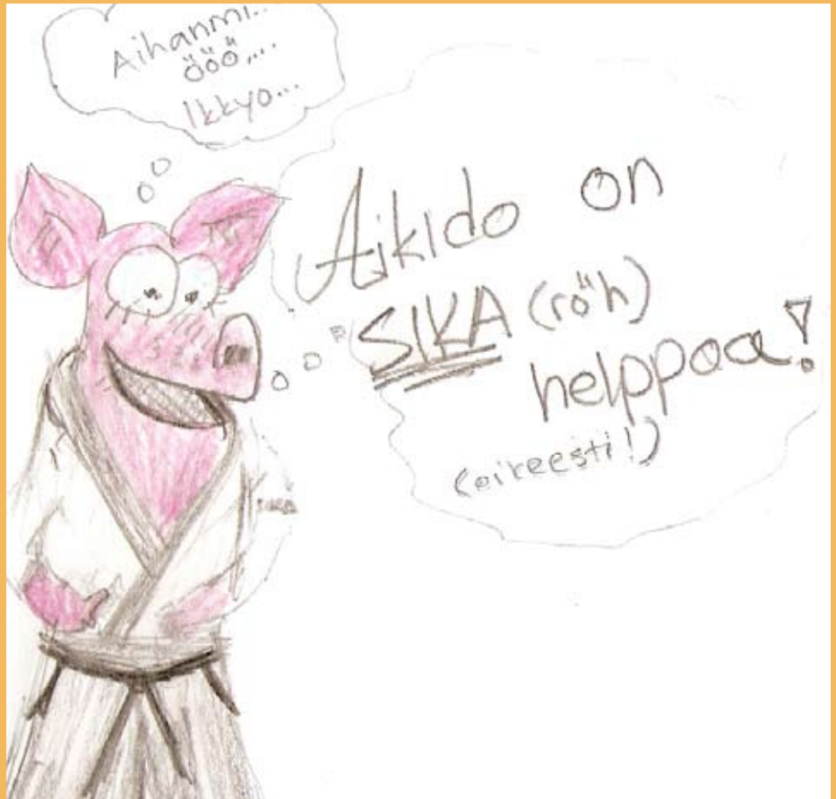
Salaa otetussa kuvassa aikidopossu Wanger possueeraa jollakin tuntemattomalla dojolla.

Shurenkan ry:n jäsenet toivottavat Wangerille pitkää ikää ja hyvää matkaa omalla aikidotiellään.