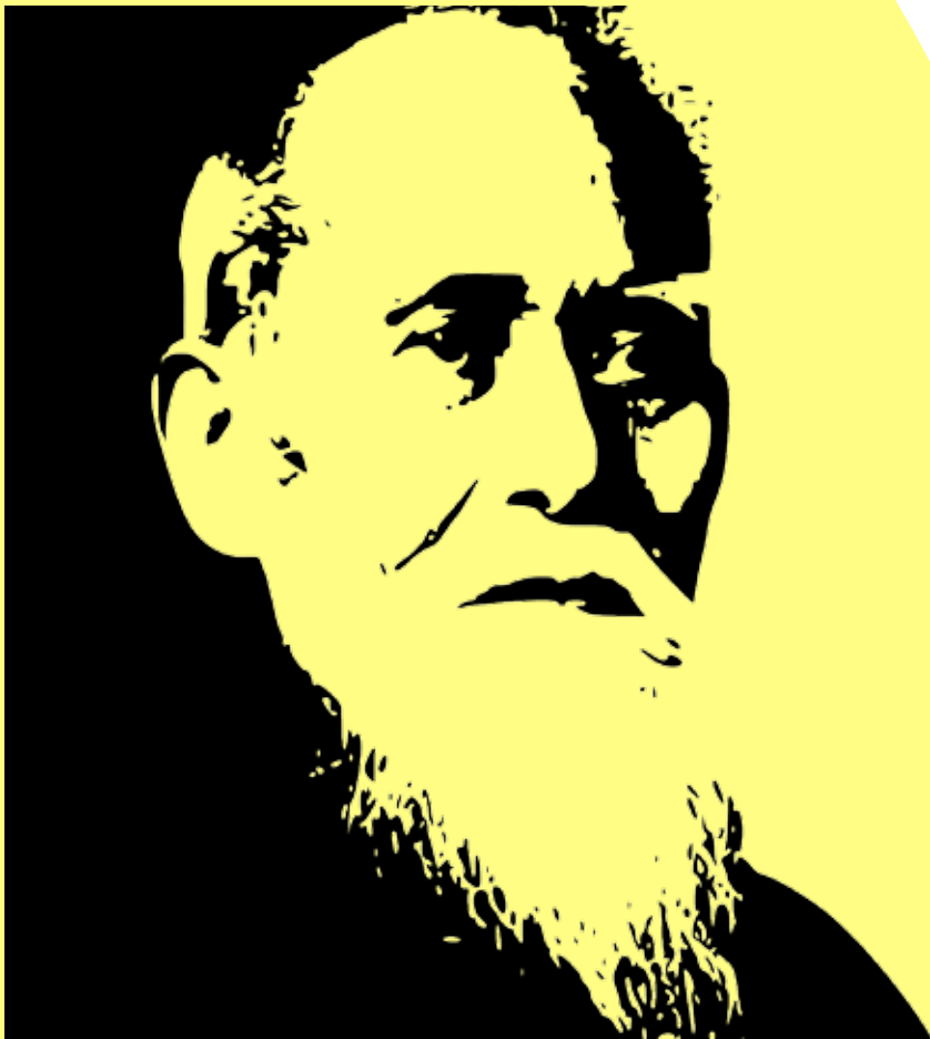
Monien budolajien mestari ja aikidon kehittäjä Morihei Ueshiba (1883-1969).

Ilmentymiä harjoittelun onnistumisesta ovat erilaiset sosiaalista vuorovaikutusta rakentavasti edistävät