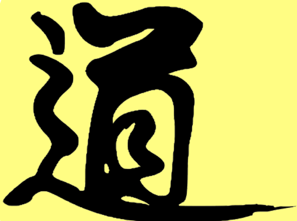
Aikidon kanji-merkeistä viimeinen eli ”do” tarkoittaa tietä.

Puhe tien kulkemisen päämäärästä saattaa myös harhauttaa tiellä kulkijaa. Monesti oman tiensä kulkijat ja tiellä oikovat sanovat ”huipulle vievän monta tietä”. Heille tietyn itsekkäistä motiiveista lähtevän tavoitteen täyttymys tai sen jälkeen asetettujen